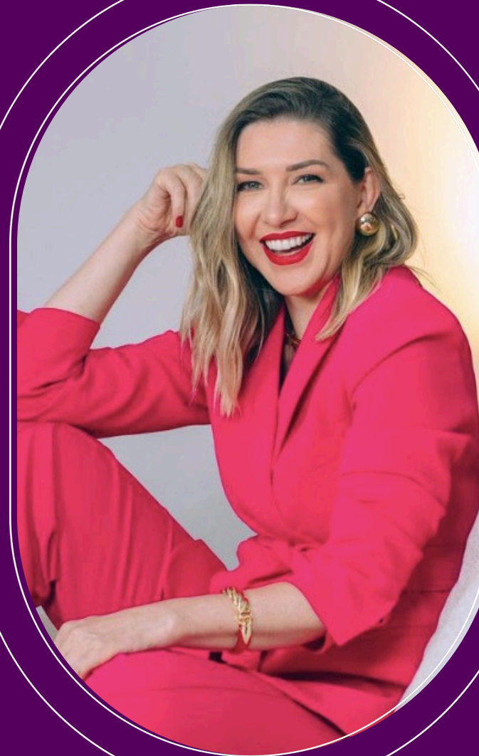
Ana Garlet @anagarlet