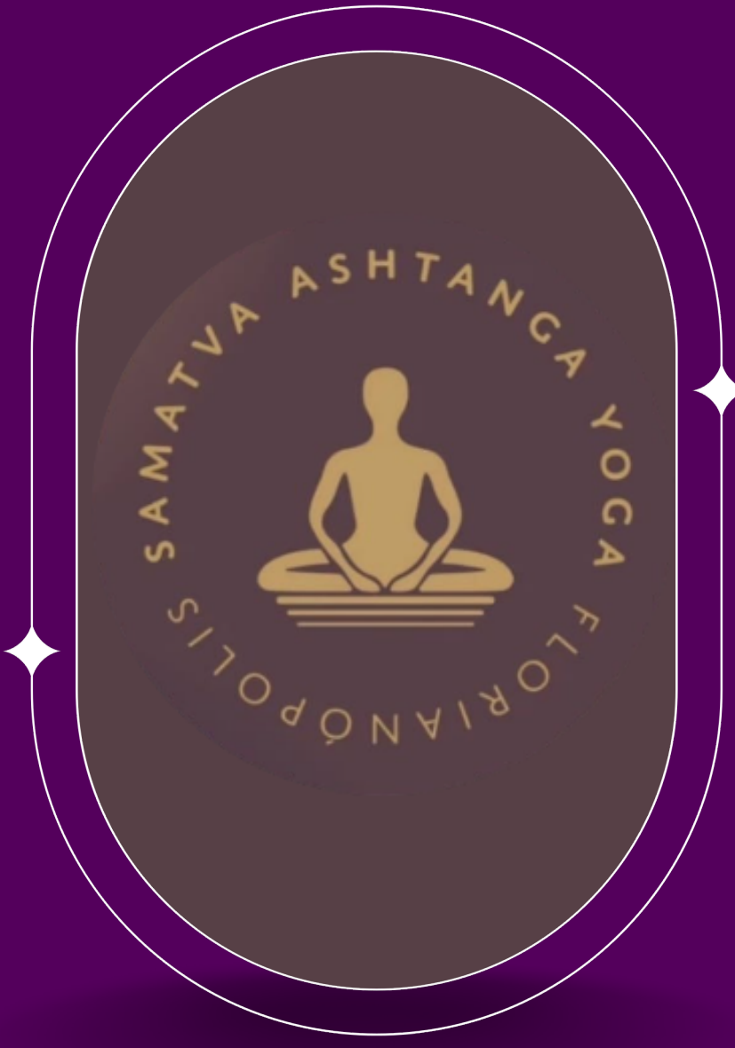
Samatva Yoga @samatvayoga