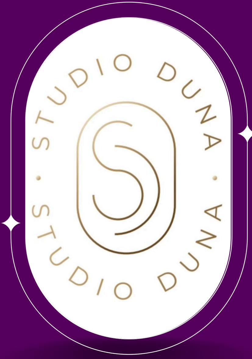
Studio Duna @duna.st