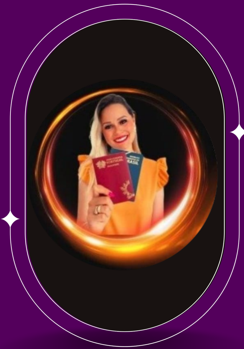
Polly | Cidadania Portuguesa @cidadaniaportuguesa sozinho