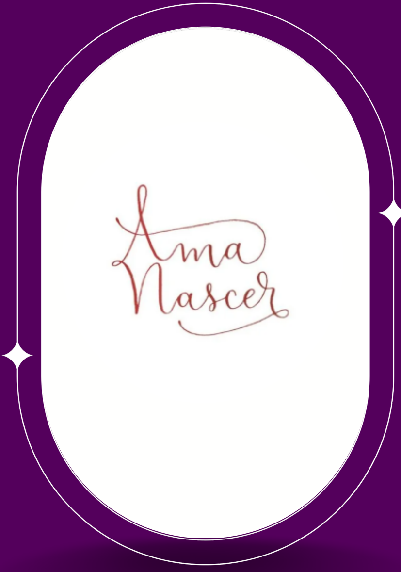
Ama Nascere @amanascere