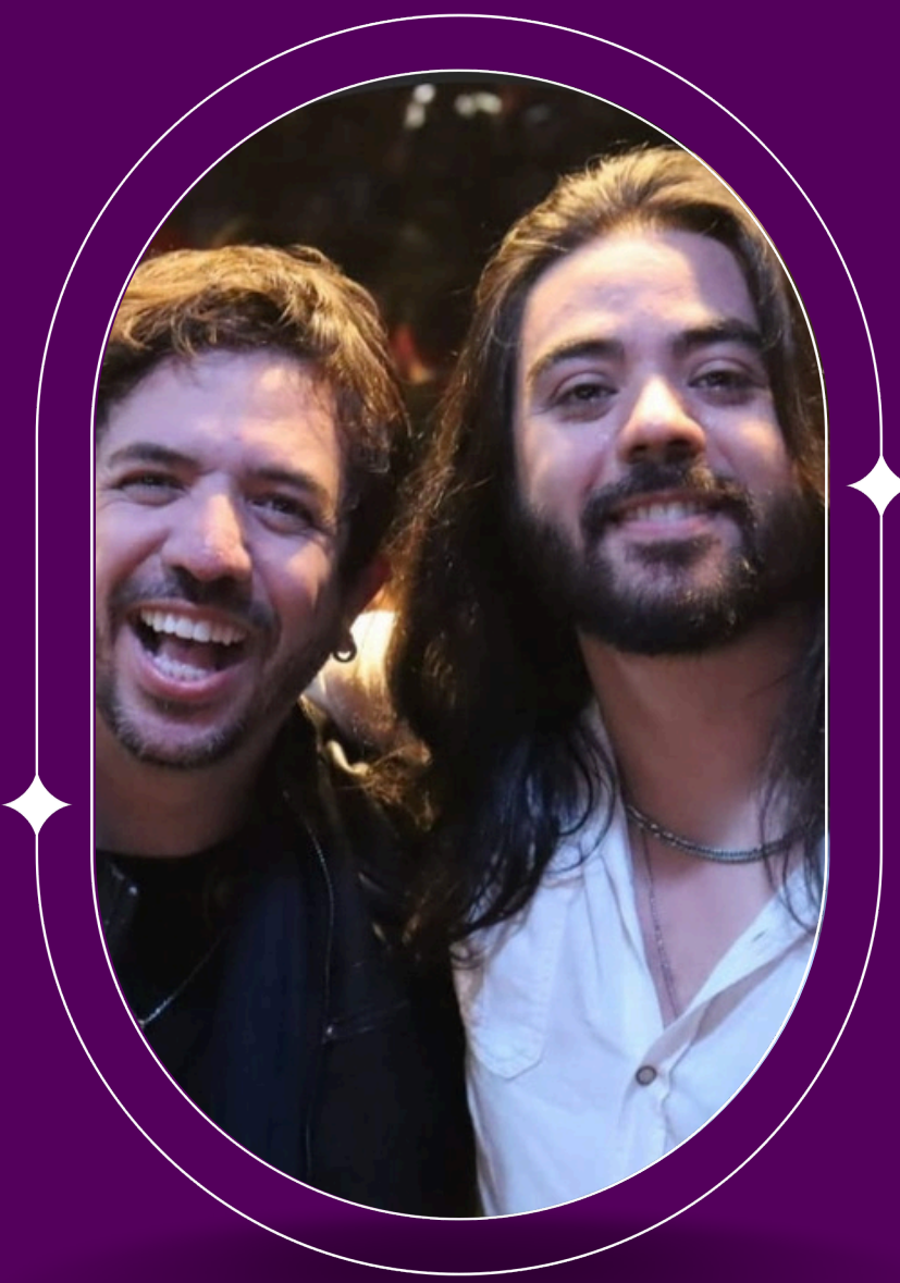
Os Manteigas @osmanteigas