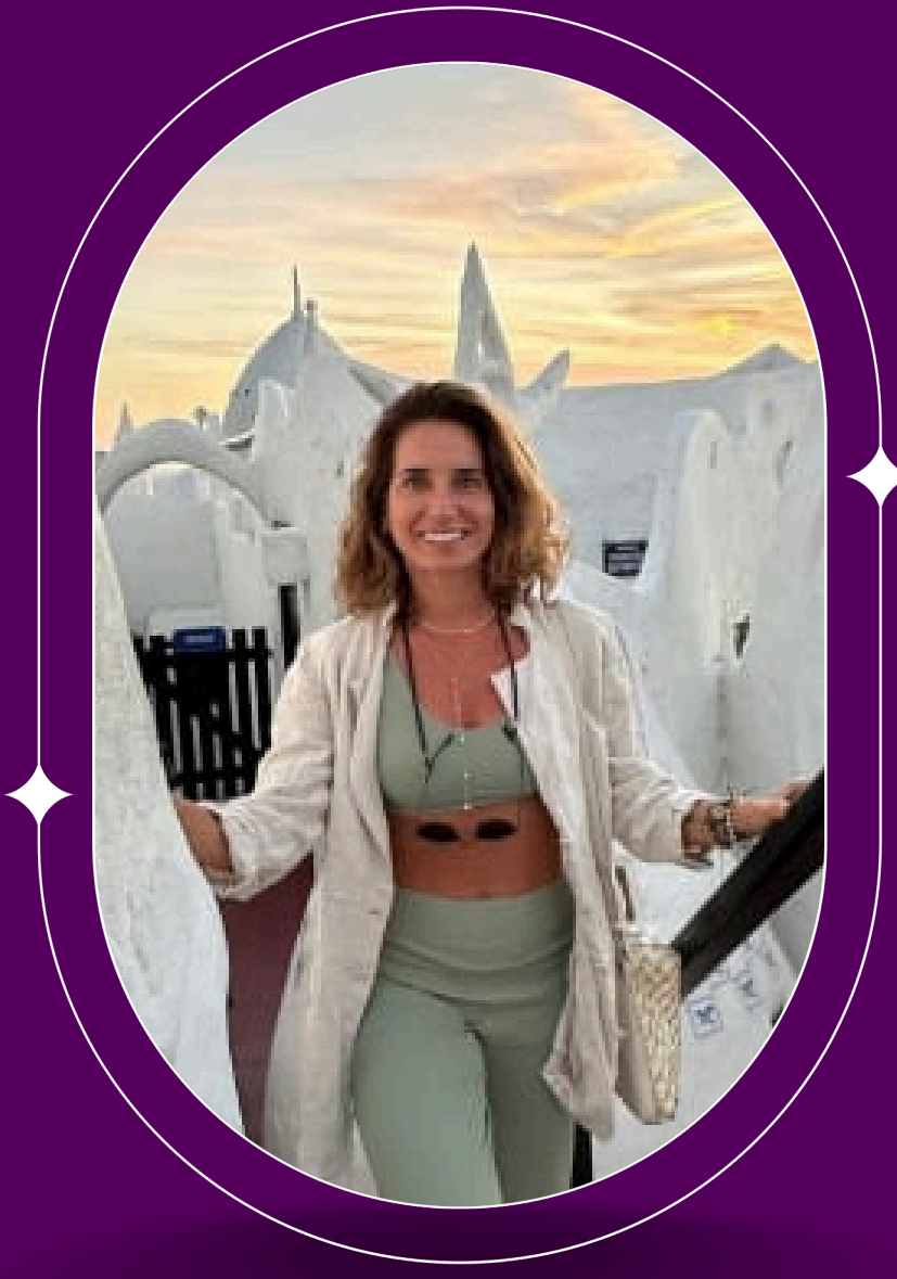
Mariana Geiger @mari_geiger